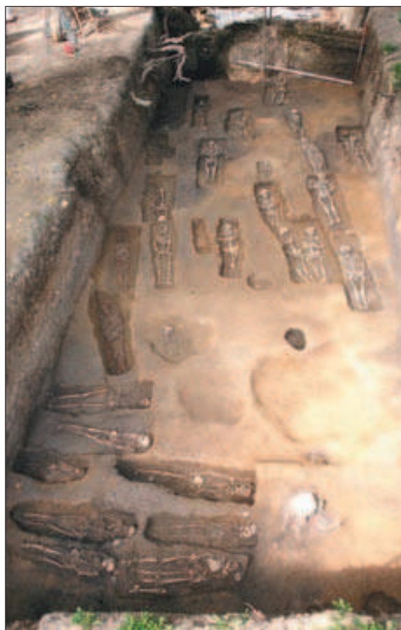
Grobovi u Sondi IX