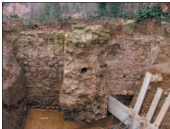
Pogled na gradski bedem i sačuvani zid kule

Premda je i ovogodišnjim istraživanjima, uz uvažavanje svih kulturnih slojeva, potvrđena ista kronološka slika kao i u dosadašnjim istraživanjima (prapovijesni sloj, horizont gradnje spomenutoga zidanog objekta, horizont groblja iz 16. st. i novovjeke strukture) rezultati su nametnuli nova promišljanja povijesnih zbivanja na jugoistočnom platou brežuljka Griča. Naime, nalazna situacija pojedinih prapovijesnih ukopa sugerira postojanje horizonta starijeg od sloja halštatske kulture starijega željeznog doba. O tome svjedoči nalaz Objekta VIII u Sondi VII,