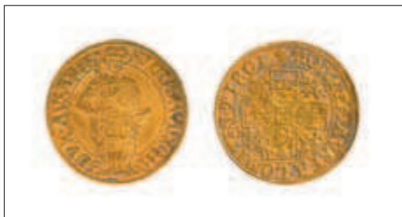
Zlatni gulden kovan nakon smrti nadvojvode Žigmunda, između 1496. i 1507. godine

Nedugo nakon prestanka funkcioniranja tog kompleksa, prema stratigrafskim odnosima na terenu, prostor današnjeg parka Grič rabljen je za gradsko groblje. Tijekom istraživanja 2007. evidentirana su 53 groba. Riječ je o grobovima s pokojnicima položenima na leđa u pravokutne rake bez vidljive arhitekture i s vrlo malo nalaza u grobovima. Kod pojedinih grobova moguće je tvrditi da su pokojnici bili položeni u drveni lijes, no za neke se može pretpostaviti da su bili umotani u tkaninu. Potonja je situacija očita na grobovima pronađenima u istočnom dijelu Sonde IX, kod kojih je zamjetna i suprotna orijentacija grobova u kojima su pokojnici polagani s glavom na sjeveru i nogama na jugu. Preslojavanje grobova zamijećeno je u nekoliko slučajeva, a dvostruki ukopi zabilježeni su u samo trima slučajevima.